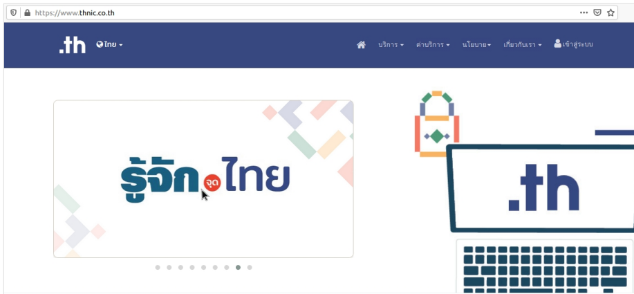
ภาพที่ 1 เว็บไซต์ทีเอชเนติก