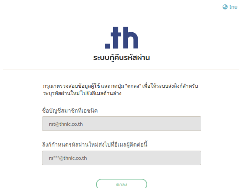
ภาพที่ 4 หน้าตรวจสอบข้อมูล