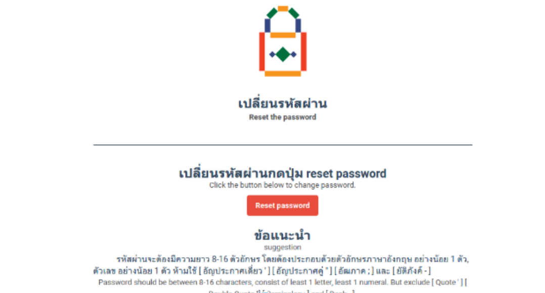
ภาพที่ 7 อีเมลเปลี่ยนรหัสผ่าน